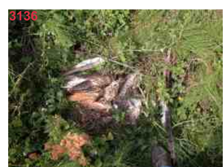
RM 53 nach 6 Wochen