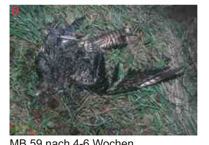
MB 59 nach 4-6 Wochen