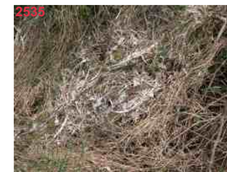
MB 46 nach 3,5 Monaten