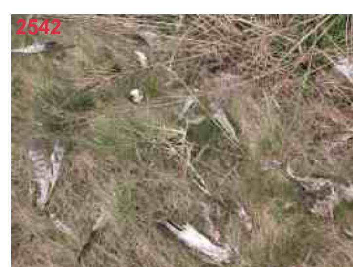
MB 44 nach 5 Monaten