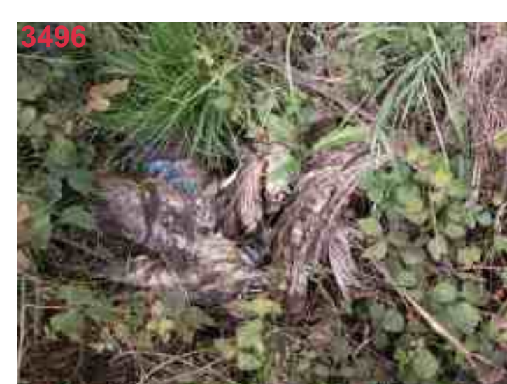
RM 53 nach 15 Wochen