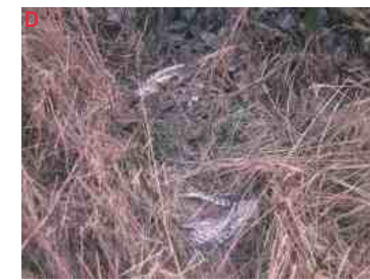
MB 2 nach max. 7-8 Monaten