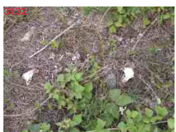
MB 52 nach über 1 Jahr