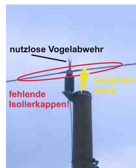
Abb. 4: Gefahrenpotential DB-Oberleitungsmast

Als Todesursachen kommen Stromschlag sowie Kollisionen mit Zug, Oberleitungsmast oder Leitungsdrähten in Frage. Die Oberleitungsmasten an der Kontrollstrecke sind hervorragende Ansetzarten für Greifvögel. Gleichzeitig stellen sie ein erhebliches Gefahrenpotential dar, da die stromführende Einspeiseleitung über der Mastspitze angebracht ist (Abb. 4). Stromschlag beim An- oder Abflug vom Mast führt zum Absturz des Vogels an Ort und Stelle. Kollisionen können sich dagegen überall an der Strecke ereignen, und der Vogel wird nach dem Aufprall i.d.R. vom Zug weggeschleudert. Da 62 % aller Todesopfer im Umkreis von 3 m um die Oberleitungsmasten, meist sogar unmittelbar am Mastfuß, gefunden wurden, spricht dies für Stromschlag als wesentliche Todesursache. Dieser Anteil ist vermutlich noch höher, da v.a. bei Rupfungen nicht auszuschließen ist, dass das Tier zuvor noch einige Meter mitgeschleppt wurde.