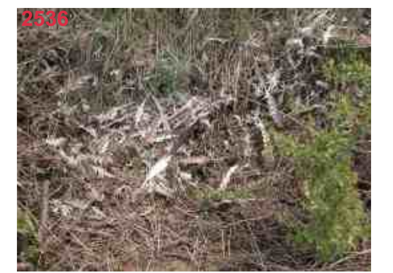
MB 47 nach 5 Wochen (Nach 9 Wochen verschwunden)