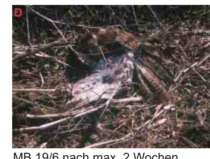
MB 19/6 nach max. 2 Wochen