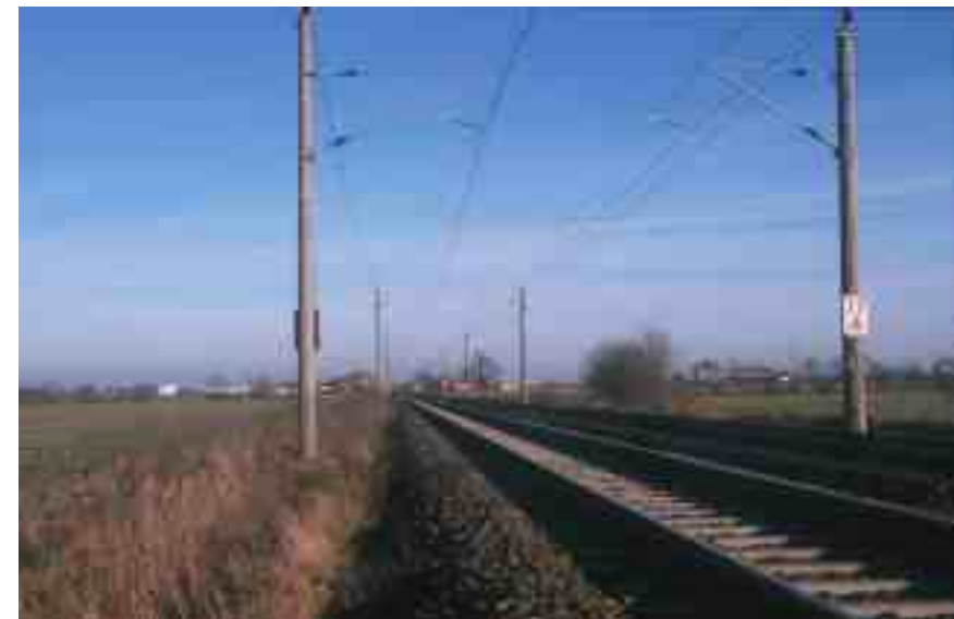
Abb. 1: Der kontrollierte Streckenabschnitt ist überwiegend gehölzfrei.