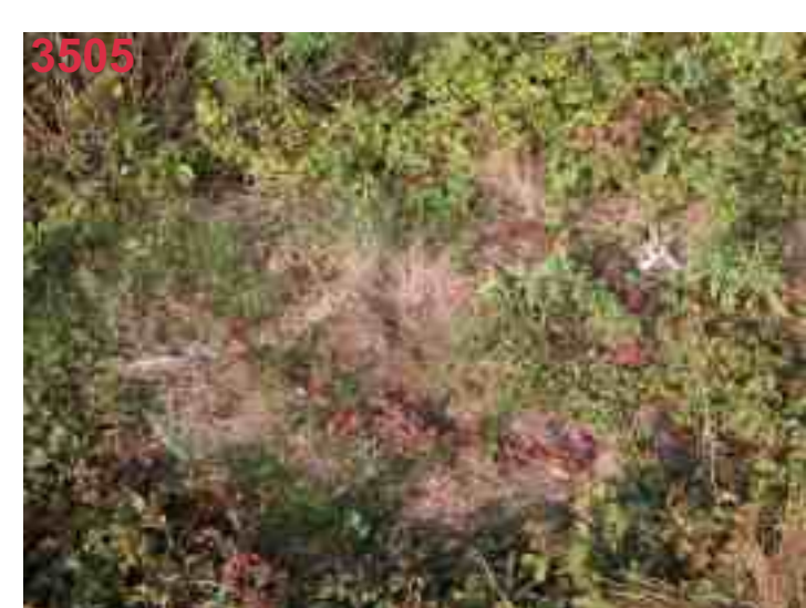
MB 44 nach 10 Monaten