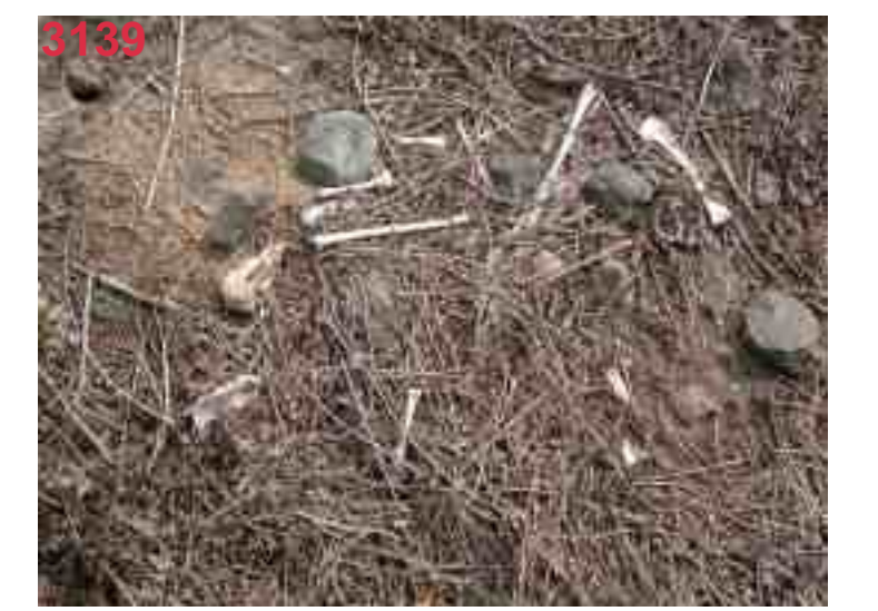
MB 54/4 (2 Ind.) nach über 2 Jahren

Bei monatlichen Streckenkontrollen werden meist nur mehr oder weniger gut erhaltene Kadaver-Überreste, Federn oder Knochen gefunden. Der ungefähre Todeszeitpunkt lässt sich anhand von Federzustand, Zersetzungs- bzw. Mumifizierungsgrad und Skelettierung grob abschätzen. Allerdings sind zahlreiche Einflussfaktoren in die Datierung einzubeziehen. Rupfungen skelettieren z.B. schneller als Kadaver bzw. sind infolge des geringen Zusammenhalts bald zerstreut oder nicht mehr nachweisbar. Kadaver skelettieren umso langsamer, je vollständiger sie sind und die Skeletteile bleichen auch entsprechend später aus. Jahreszeit und Witterung (v.a. Temperatur, Sonneneinstrahlung, Feuchte und Wind) sind weitere wesentliche Einflussfaktoren auf die Zersetzungs- und Zerfallsprozesse. Bei sehr alten Überresten (> 1 Jahr) ist die Knochenbleiche meist abgeschlossen. Grobe Rückschlüsse auf das Alter sind dann nur noch anhand der überwachsenen Vegetation möglich.